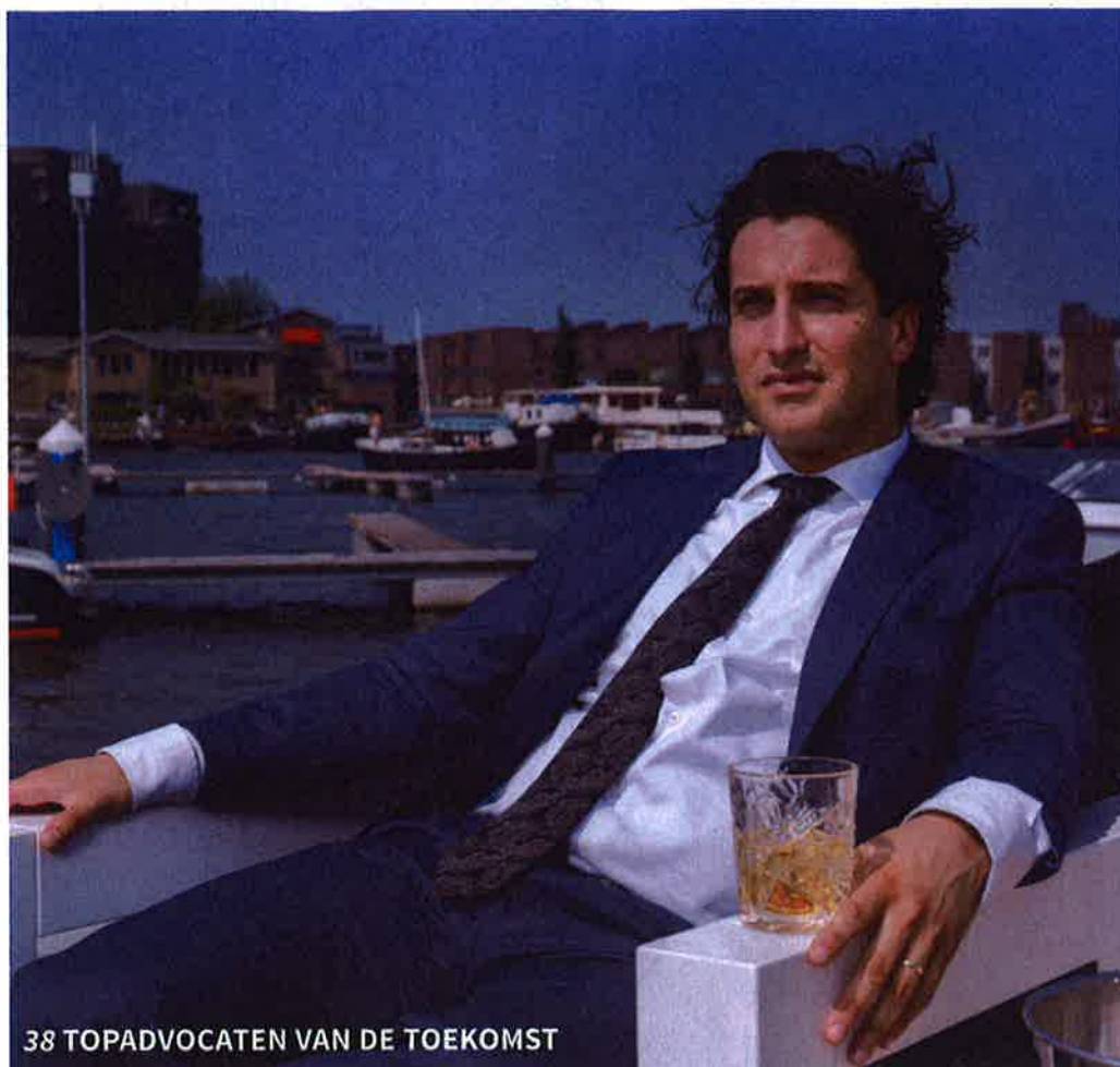
38 TOPADVOCATEN VAN DE TOEKOMST