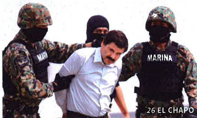
26 EL CHAPO